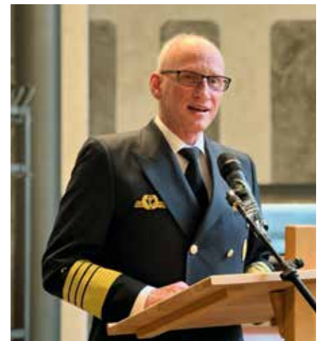
Admiral Rühle stellte nicht zuletzt aufgrund der aktuellen Lage in der Ukraine interessante Fakten vor

Admiral Rühle stellte nach der Begrüßung den Krieg in der Ukraine an den Anfang seines Referates. „Seit über drei Wochen stehen ukrainische Streitkräfte und Tausende Freiwillige in einem heldenhaften Abwehrkampf gegen eine nicht provozierte Aggression.“ Es sei beeindruckend und beispielgebend, mit welchem Kampfes- und Durchhalten sich die Ukrainer gegen die mili-