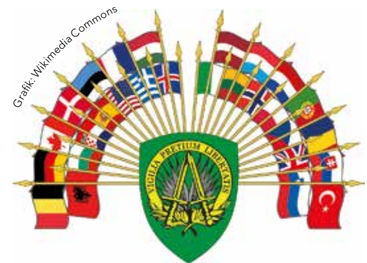
Wappen des SACEUR mit den Flaggen der Mitgliedsländer

Eine strategische Überraschung sei der Umbruch der europäischen Sicherheitslage nicht gewesen. Seit der Annexion der Krim 2014 habe die Allianz zahlreiche Maßnahmen zur Steigerung der Reaktionsfähigkeit und Einsatzbereitschaft ergriffen. 2019 gab sich die Allianz eine neue Militärstrategie. Russland wurde als strategischer Wettbewerber und neben dem Terrorismus als eine von zwei Hauptbedrohun-