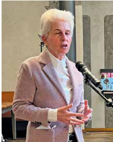
Dr. Marie-Agnes Strack-Zimmermann bei ihrem Grußwort